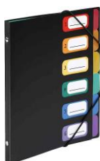
un trieur avec 6 parties