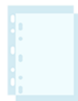
100 pochettes transparentes