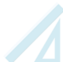
une règle de 20cm et une équerre

Vous pouvez réutiliser le matériel de l'année dernière (classeur avec intercalaires, trieur, ardoise, chemise...).