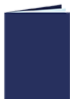
un porte-vues (60 vues)