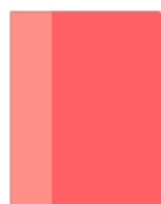
un cahier 21x29,7 rouge polypro 96p grands carreaux