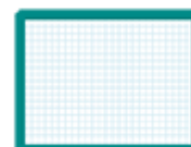
une ardoise blanche