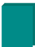
un grand classeur (dos 40mm)