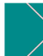
une chemise verte à rabats