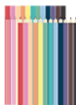
12 feutres et 12 crayons de couleurs